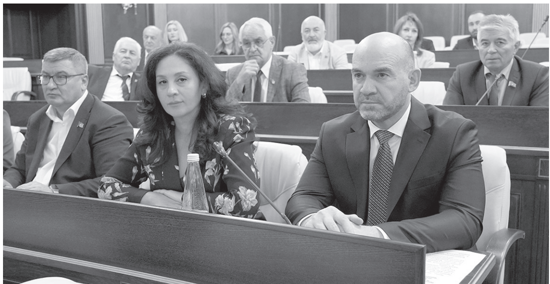
Депутаты Парламента КЧР внимательно слушают выступающих