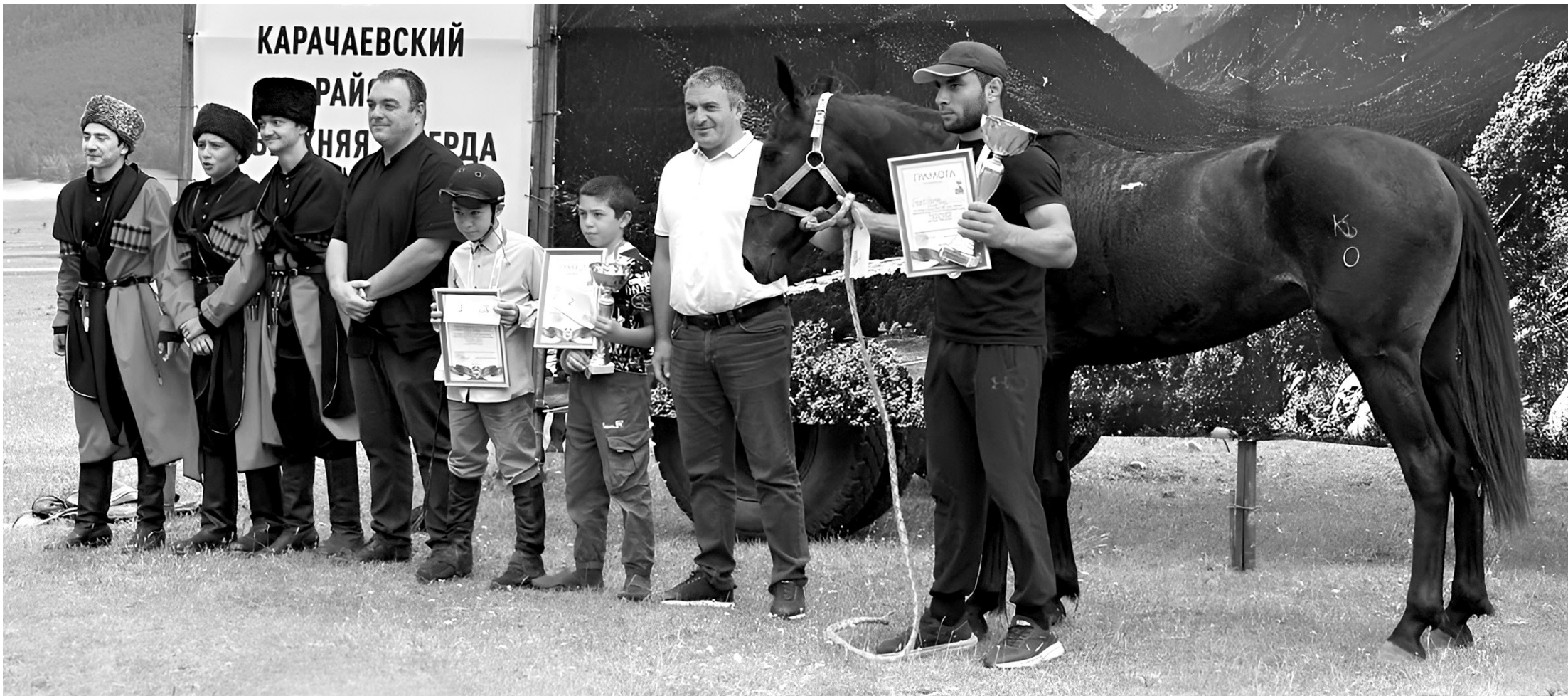
Чествование победителей конных состязаний, проведенных в ауле в честь 80-й годовщины Победы и посвященных памяти участников Великой Отечественной войны — выходцев из Верхней Теберды

— Хороший напор воды гарантирует полив приусадебных грядок с зеленью, помидорами, огурцами... А как быт с выпасами? Чем в период летней засухи кормится скот?